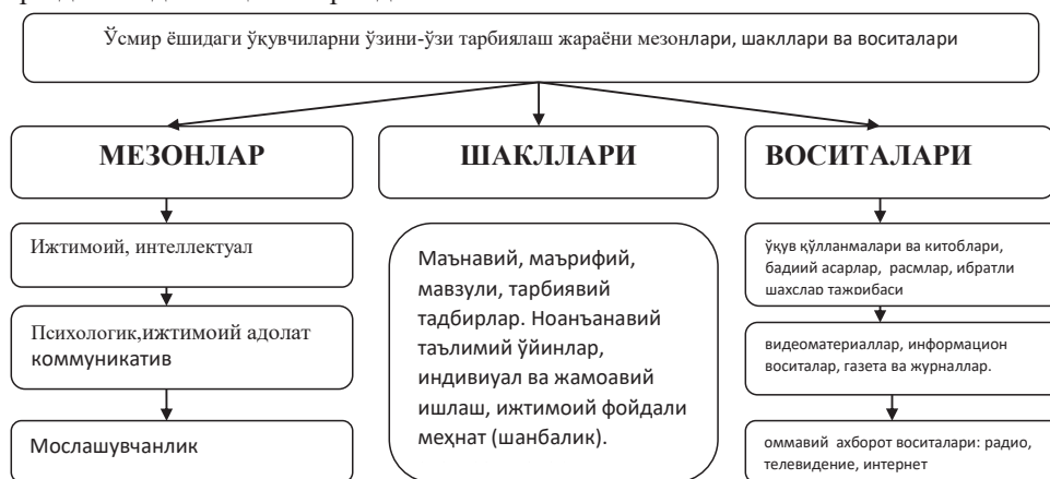
1.1-расм. Ўсмир ёшидаги ўқувчиларни ўзини-ўзи тарбиялаш жараёнини такомиллаштириш мезонлари

Таълимни ахборотлаштириш шароитида “ўсмир ёшидаги ўқувчиларни ўзини-ўзи тарбиялашда ижтимоий аҳамиятга эга мақсадларнинг мавжудлиги” педагогик жараёнда ўзини-ўзи тарбиялаш тушунчаси мазмун моҳиятини очишга ёрдам берувчи, ўзига хос тушунча ва педагогик категориялар тизимини акс эттирувчи педагогик шарт-шароитлар, шакл, метод ва воситаларини тўғри танлашга боғлиқдир. Ўқувчиларда жамоада ишлаш кўникмаларини шакллантириш мезонлари, шакллари ва воситалари тажриба- синов ишлари давомида аниқлаштирилди.