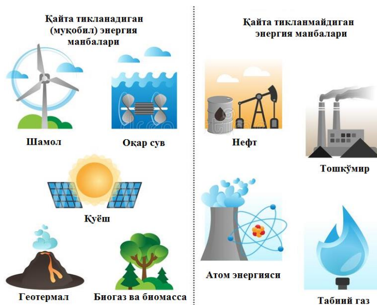
1-расм. Табиатдаги энергия манбалари.

Талабаларнинг муқобил энергияга оид мотивацияларини инobatга олиб, уларнинг педагогик-психологик ва физиологик хусусиятларига мос равишда (ижтимоийлик, коммуникативлик, интеллектуаллик, ахборотлилик) компетенциялари белгилаб олинди.