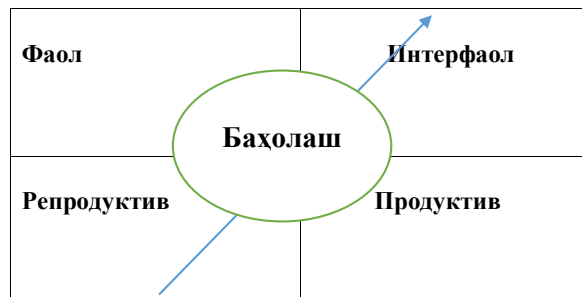
2-расм. Баҳолаш воситалари типлари.

Ҳар бир компетенцияни талаба унга эришишнинг эҳтимолий даражалари орқали намойиш этиш ва бунда бу даражага мос индикаторлар (ўқиш натижалари) ва дескрипторларни (ўқиш натижаларига қанчалик муваффақиятли эришилгани кўрсаткичлари) шакллари (компетенциялар паспортлари, компетенциялар хариталари, матрицалари, матнда баён этиш) турлича бўлиши мумкин. Таълим дастурини лойиҳалаштириш босқичида ишлаб чиқилган ва ўқитувчилар жамоаси томонидан ифодаланган битирувчининг компетенцияси модуллар ёки таълим дастурининг бошқа элементлари ишчи дастурларини шакллантириш учун асос қилиб олиниши жуда муҳим.