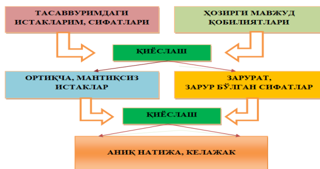
5-расм. Шахсий-креатив компетенцияни ривожлантришга йўналтирилган “келажакка назар” усули