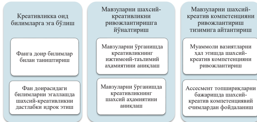
3-расм. “Бошланғич таълим педагогикаси, инновация ва интеграция” фанини ўқитишда шахсий-креатив компетенцияни ривожлантириш технологияси

Технологик ёндашувнинг умумий тавсифига таянган ҳолда, тадқиқот доирасида “Бошланғич таълим педагогикаси, инновация ва интеграция” фанини ўқитишда бўлажак бошланғич синф ўқитувчиларида шахсий-креатив компетенцияларини ривожлантиришнинг қуйидаги технологияси ишлаб чиқилди (3-расмга қаранг.).