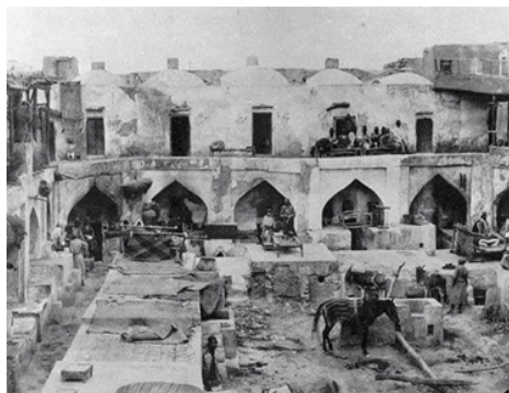
Бухородаги Ҳиндлар Карвонсаройи, 1890-йилдаги Француз Пол Надар сурати.