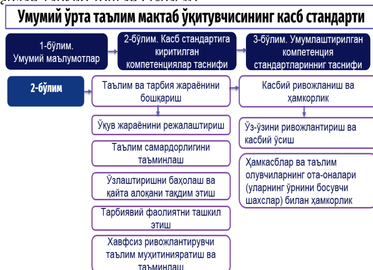
1-расм. Умумий ўрта таълим мактаб ўқитувчисининг касб стандарти тузилмаси

Касб стандарти ўзига хос тузилишга эга бўлиб, бўлимлар, фаолият турининг асосий мақсади, касб стандартига киритилган меҳнат вазифаларининг таснифи, умумлаштирилган компетенция стандартлари ва бошқа шу каби компонентлардан ташкиб топган (1-расм):