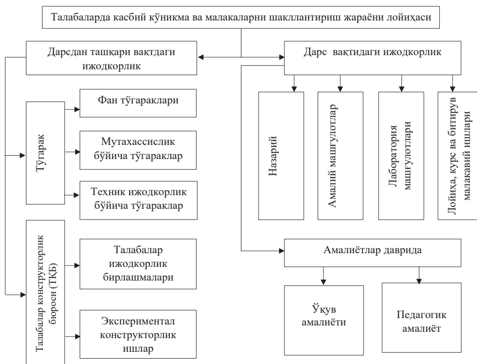
2-шакл. Касбий кўникма ва малакаларни шакллантириш жараёни лойиҳаси

Юқорида қайд этилган касбга йўналтириш истиқболли лойиҳаси асосида мавзуга оид иккинчи босқич лойиҳаси, яъни бўлажак технологик таълим ўқитувчилари касбий кўникма ва малакаларини шакллантириш технологиялари лойиҳаси асосан дарс вақтида ва дарсдан ташқари вақтларда амалга оширишни назарда тутди (2-шакл).