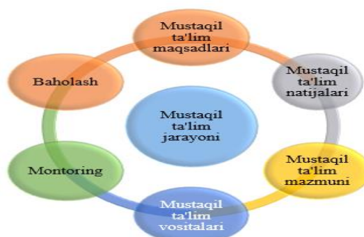
1-rasm. Musataqil ishlarni tashkil etish tartibi

Talabalarning mustaqil ta'limini tashkil etishning asosiy vazifasi har qanday shakldagi darslarda intellektual tashabbus va tafakkurni rivojlantirish uchun psixologik-didaktik shart-sharoitlarni yaratishdan iborat. Mustaqil ta'limni tashkil etishning asosiy printsipti muammoli masalalarni hal qilishda o'z fikrini shakllantirish va talabning passiv roli bilan muayyan vazifalarni rasmiy bajarishdan kognitiv faoliyatga o'tish bilan barcha talabalarni individual ishlarga o'tkazish bo'lishi kerak [7].