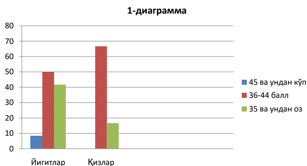
тарих факултети 1-курс талабаларининг натижаларини диаграммадаги кўриниши

Жадвалдаги сонлар тахлили асосида талаба йиғитларнинг 22,2% қизларнинг қизларнинг эса 6,5% да ўта агрессивлик мавжуд эканлиги намоён бўлади. Респондентларнинг 36,9% ўзига ишончли йўқотган ва паст баҳо берувчи қизлар эканлиги билан ажралиб турибди.