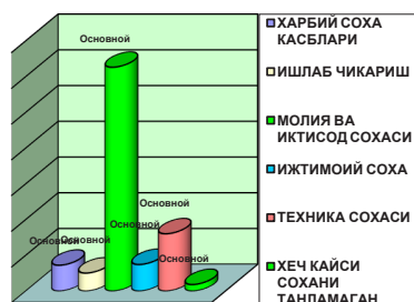
1-расм. Ўқувчиларнинг касбга қизиқишларини шаклландириш ҳолати (назорат гуруҳи)

ЁЧҚБТ дарси материаллари, дарс мавзуси ҳисобга олинган ҳолда, ўқувчиларни ҳарбий касбларга оид кўшимча маълумотлар билан таъминланди. Бу тадбирлар ўқувчиларни ҳарбий касбларга оид кўшимча билимларни ўзлаштиришларига имкон яратди, уларнинг билиш фаоллигини оширди.