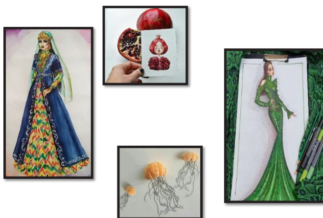
1.1-rasm. Dizayn san'ati

bilimlarni berish amalga oshiriladi, keyin esa bahs-munozara, kichik guruhlarda ishlash va boshqa shu kabi noan'anaviy metodlarni amalga oshirish orqali berilgan bilim mustahkamlanishi lozim. Har qanday holatda ham nazariy dars jarayonida, masalan, ma'ruza 20 daqiqadan oshmasligi kerak. Chunki o'rganishning dastlabki 20 daqiqasi eng samarali, 30 daqiqadan keyin esa o'rganishni davom ettirish motivatsiyasi tezda pasaya boshlaydi. Tasviriy san'at darslarini samarali va qiziqarli olib borish uchun o'qituvchi avvalambor kreativ bo'lishi, interfaol usullar va texnologiyalardan o'z o'rnida foydalanib bilishi kerak. Masalan, tasviriy san'at fanidan "Dizayn san'ati" mavzusini tushuntirishda, o'qituvchi nafaqat o'zbek, balki chet ellik rassomlarning ijodiy ishlaridan, hamda o'qituvchi o'zining kompozitsiya (lot.compositio-tuzish, ijob qilish, g'oya) ishlaridan ham namuna sifatida ko'rsatishi, bu o'quvchilarning bilim, malaka va ko'nikmalarini asosan dars davomida shakllantirib, hamda ularni yaxshiroq taassurotga ega bo'lishlari va ijodiy qobiliyatlarini o'stirishga yordam beradi