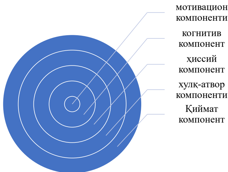
1- Расм. Коммуникатив компетенцияга эга бўлиш фаолият йўналиши унинг таркибий қисмларини аниқлаш имкониятини белгиланиши

Мактабгача таълим ташкилотларида ўқув жараёни шундай ташкил этилиши керакки, нафақат мактабгача ёшдаги болаларда иккинчи тилга оид билим, кўникма ва малакаларни ривожлантириш, балки уларни амалиётда қўллай олишлари муҳим саналади. Бу эса психолингвистик нуқтаи назардан коммуникатив ёндашув асосида тил таълимшунослигини янада ривожлантириш имконини беради.