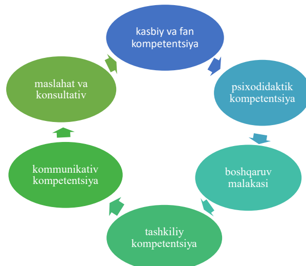
1-rasm. Dual ta'lim tizimida o'qituvchining mavjud kompetensiyalari

Dual ta'lim tizimida, ayniqsa, o'rta kasb-hunar maktablarida o'quvchilarni tayyorlashda yoki korxonalarda kasbiy ta'limni amalga oshirishda o'qituvchilarning kompetensiyalari masalasi muhim ahamiyatga ega. Kontseptsiyani aniqlash va vakolatlar ma'nosini tavsiflash uchun adabiyotda turli xil ta'riflar mavjud. O'qituvchining bilim va ko'nikmalarining muayyan yo'nalishlari majmui sifatidagi kompetensiyalari maxsus kichik kompetensiyalardan iborat: kasbiy va fan kompetensiyalari, psixodidaktik kompetensiyalar, kommunikativ kompetensiyalar, tashkiliy kompetensiyalar va boshqaruv malakasi, maslahat va konsultativ kompetensiya va o'z faoliyatini aks ettirish.