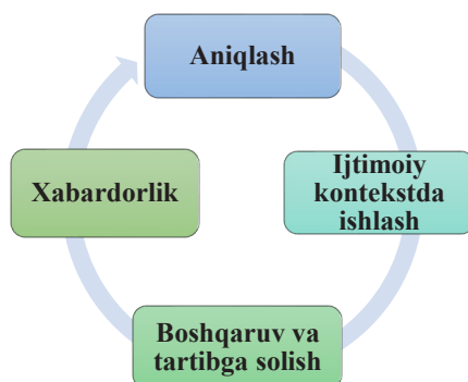
2-rasm. Affektiv ijtimoiy kompetensiyaning asosiy komponentsiyasi