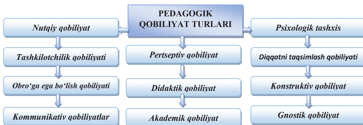
2-rasm. Pedagogik qobiliyat turlari

Nutqiy qobiliyat-ixcham, ma'noli, ohangdor, muayyan ritm, temp, chastotaga ega bo'lgan nutq, shuningdek, o'qituvchi nutqining jarangdorligi, uning pauza, mantiqiy urg'uga rioya qilishi, qobiliyatli o'qituvchining nutqi darsda bamisha o'quvchilarga qaratilgan bo'ladi.[3.330.] Nutqiy qobiliyat o'qituvchi uchun eng muhim qobiliyat turi sanaladi. O'quvchiga ta'sir etuvchi omil nutqdur. Dars jarayonida materialni o'quvchiga mos shakilda soda, ravon shakilda tushuntirilsa dars samaradorligi oshadi. So'zlovchi (o'qituvchi) nutq so'zlayotganda mantiqiy fikrga, fikrning tugallanganligiga e'tibor qaratishi kerak. O'qituvchining nutqiy qobiliyati birdaniga shakllanadigan jarayon emas, u vaqtlar o'tib madaniy, kasbiy, pedagogik talablar, malaksi oshib borgani sari rivojlanib boradi.