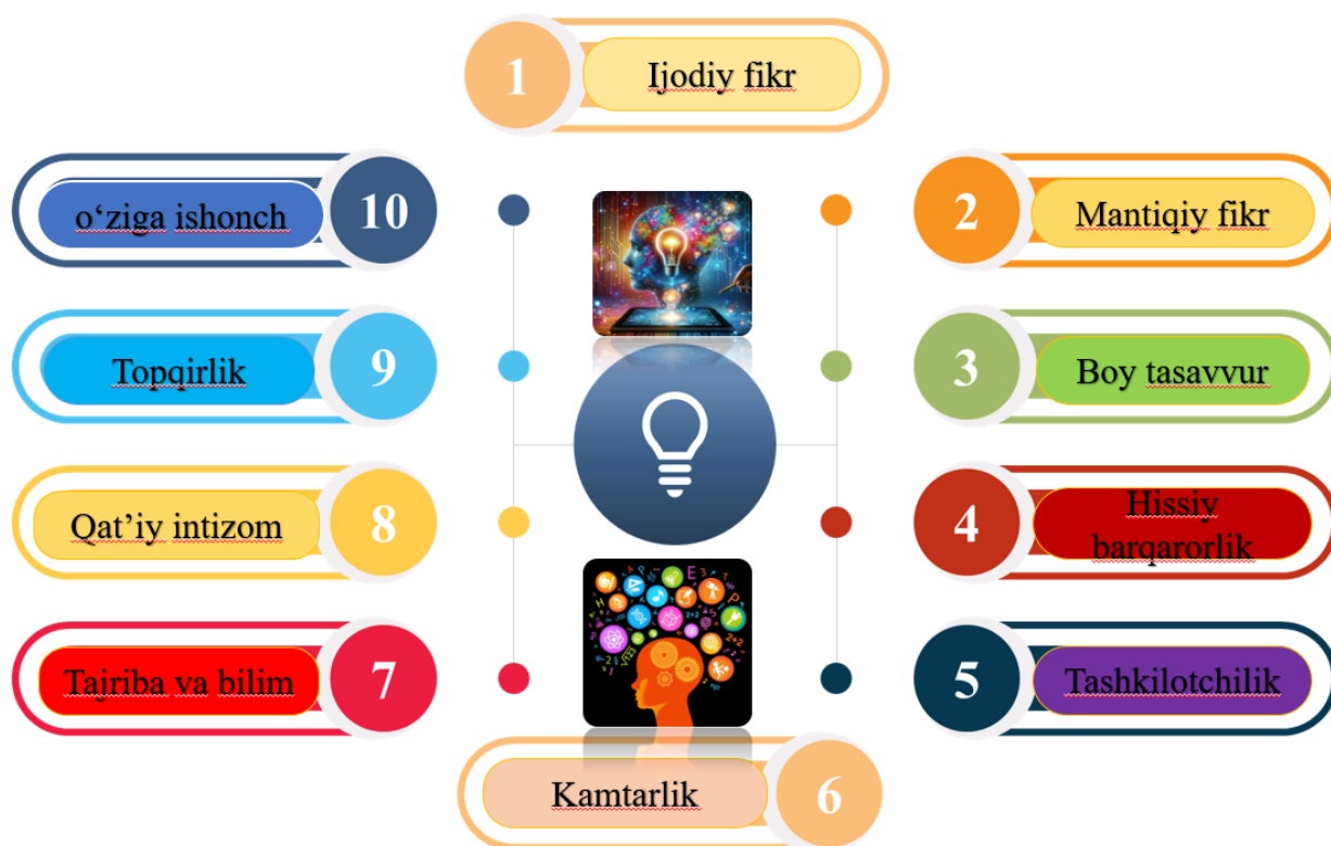
1-rasm. Kreativ shaxsda mujassam xususiyatlar

Olimlarning nazariy qarashlariga asosan, kreativ inson ikkita komponentni o'z ichiga olgan motivatsiya va harakat sifatida bog'langan xulq-atvor bilan bog'liq. Motivatsiya kasbiy xulq-atvorni shaxsning ichki harakatini anglatadi. Kasbiy xulq-atvorning ushbu asosiy manbasiga e'tibor qaratish har xil kasbiy rivojlanishni talab etadi. Shuning uchun, motivatsiya insonlarning hatti-harakatlariga nisbatan dinamikdir.[5.]