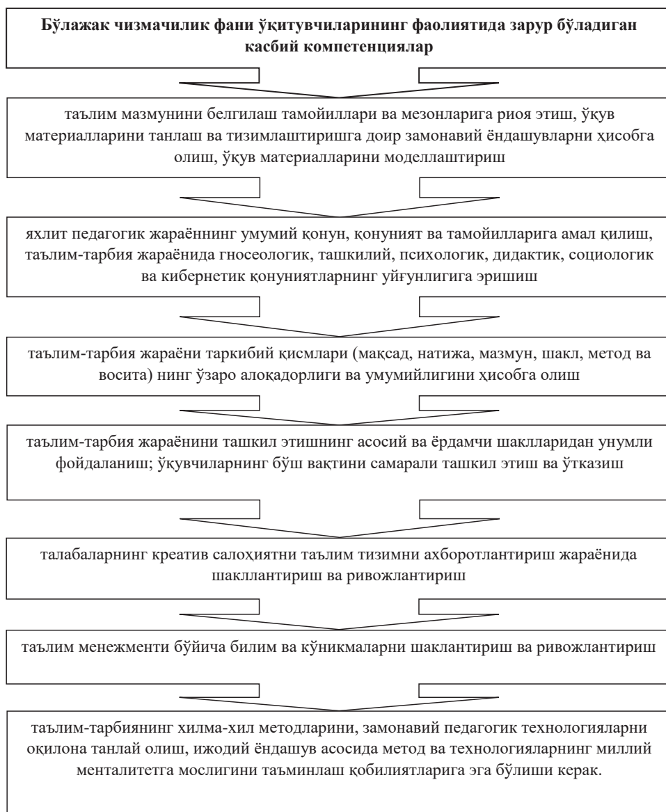
2-расм. Бўлажак чизмачилик фани ўқитувчиларининг фаолиятида зарур бўладиган касбий компетенциялар

Тадиқотлар ва изланишлар жараёнида бўлажак чизмачилик фани ўқитувчиларининг касбий ривожланиши учун ва касбий фаолиятида зарур бўладиган компетенциялар аниқланди. 1-расмда бўлажак чизмачилик фани ўқитувчиларининг касбий ривожланиши учун ва 2-расмда касбий фаолиятида зарур бўладиган компетенциялар мажмуи келтирилган.