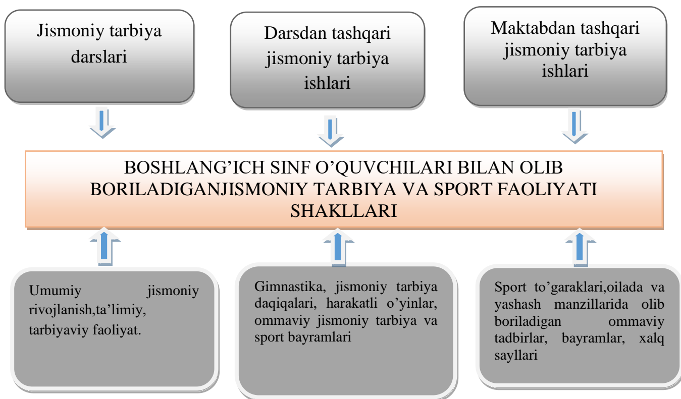
2-rasm. Boshlang'ich sinf o'quvchilarida jismoniy sifatlarni rivojlantirish shakllari

Jismoniy tarbiya darsi umumiy o'rta ta'lim maktablarida o'quvchilar jismoniy tarbiyasining eng asosiysi hisoblanadi. Chunki dars qonun qoidalar asosida o'tkaziladi va nazorati olib boriladi.[8]. Darsdan tashqari ishlarga darsgacha gimnastika mashqlari, jismoniy tarbiya daqiqalari, katta tanaffuslardagi uyushtiriladigan harakatli o'yinlar, ommaviy jismoniy tarbiya va sport bayramlari kiradi. Maktabdan tashqari ishlarga bolalar va o'smirlar sport maktabi sport to'garaklari, ko'rik-tanlovlari, ommaviy tadbirlar, sport