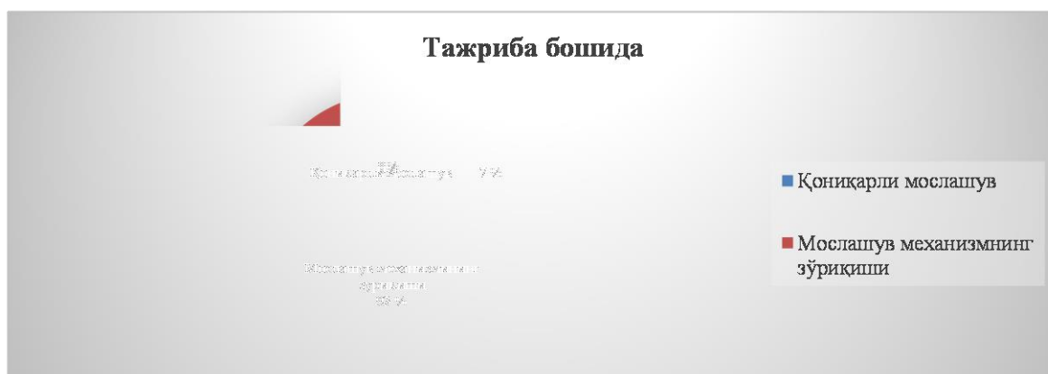
3 - расм. Электив курс талабалари организмнинг чегаравий функционал ўзгаришлар нисбати.

Ўқув сессия даврида махсус ташкил этилган электив курс машғулот воситалари ва методлари самарасида талабалар организмнинг функционал ҳолатида қониқарли мослашув чегарасига қараб ижобий силжиш тенденцияси намоён бўлди (3 а-расмга қаранг).